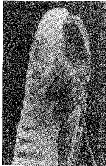
Abb. 2 Angeschwollene Nackenhaut bei einem schlüpfreifen Embryo von Platycleis grisea .

In den letzten Embryonalstadien, in denen diese Leiste sukzessive sklerotisiert wird, nimmt der Embryo durch Wasseraufnahme an der Größe zu und gleichzeitig schwillt die Nackenhaut zu einer unterschiedlich großen Blase an; in manchen Fällen, wie z.B. bei Platycleis grisea (Abb. 2) überragt sie sogar den Kopf des Embryos. Durch diesen Druckpolster wird der Ovirup-