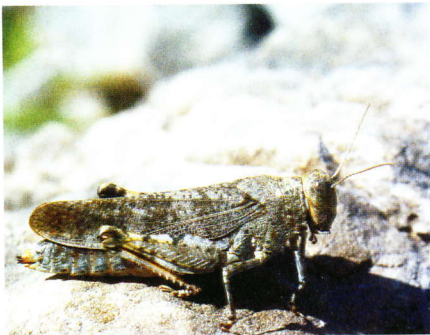
Abb. 6: Bryodemella tuberculata ♀ (Schwarzwassertal 27.07.03).