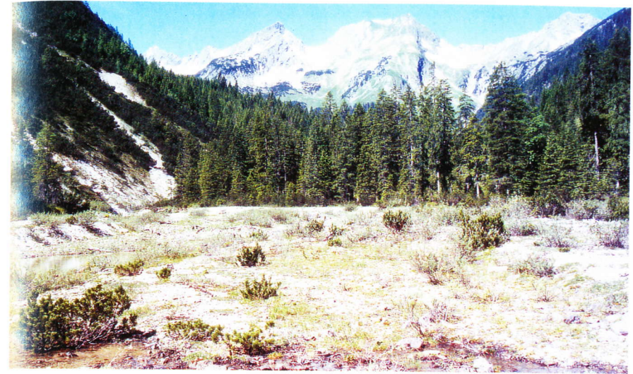
Abb. 3: Ältere Kiesbank (Habitat von Bryodemella tuberculata und Chorthippus pullus (fast vegetationsfreie, schütterere und lückige Bereiche) sowie Psophus stridulus und Tetrix tenuicornis (lückige Bereiche)).