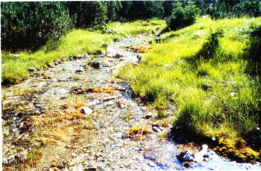
Abb. 5: Quellgebiet in der Talsohle (u.a.: Stethophyma grossum und Metrioptera brachyptera ).