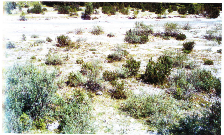
Abb. 4: Zonierung des Bachbettes (Ältere Kiesbank: aufkommendes Weidengebüsch, schütterere bis lückige Vegetation; Rinnen (teilweise trockenfallend); nahezu vegetationsfreie Kiesbänke; ältere Kiesbänke mit schütterer Vegetation; beweideter Rasen). (Bezüglich der zugehörigen Arten vgl. Abb. 2).