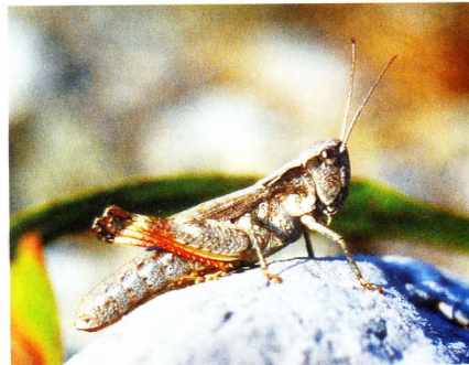
Abb. 7: Chorthippus pullus ♀ (Schwarzwassertal 08.08.03).

Tetrix tenuicornis fand ich auf lückigen Kiesflächen und vereinzelt auf Störstellen des Rasens (vor allem Trittschäden durch Weidevieh). Das Vorkommen von Stethophyma grossum , insgesamt nur wenige Exemplare, war streng auf die kleinen Feuchtgebiete beschränkt. Hier war auch Metrioptera brachyptera am häufigsten. Bezüglich der übrigen Arten, bei denen kein ökologischer Bezug zur Talauere erkennbar ist, sei auf obige Tabelle und Abbildung 2 verwiesen. Keinesfalls ist in der vorliegenden Auflistung das gesamte Artenspektrum erfasst. Dies trifft insbesondere auf weitere zu erwartende Dornschreckenarten ( Tetrix spec. ) zu.